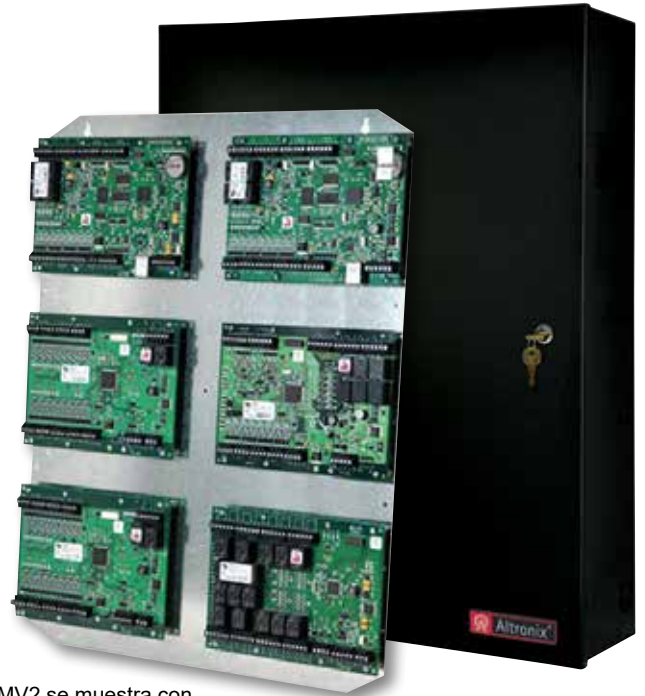
TMV2 se muestra con tarjetas opcionales Mercury

Producto - 8.0 lbs. (3,63 kg) Empacado - 9.0 lbs. (4,08 kg)