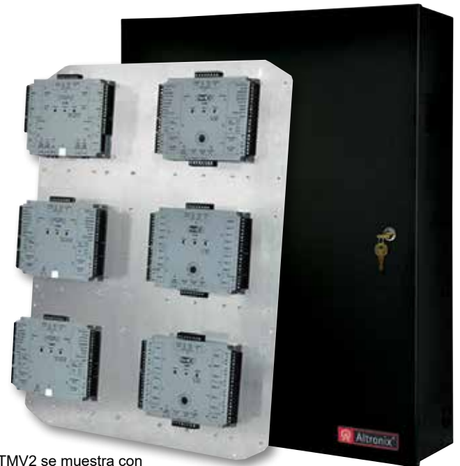
TMV2 se muestra con tarjetas VertID® HID opcionales